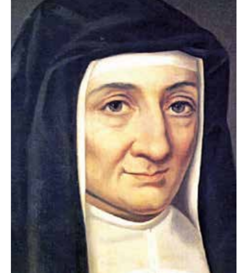
Luise von Marillac (1591 - 1660)