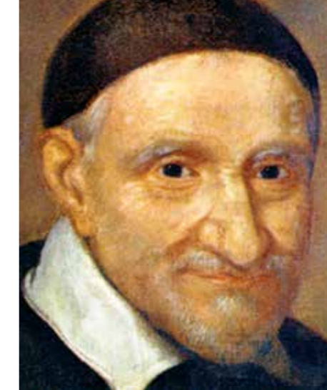
Vinzenz von Paul (1581 - 1660)